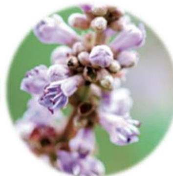
フランスラベンダーエキス セイヨウニンジンボクエキス ～幸せホルモン産生～

ストレスの解消に重要な 「 \beta -エンドルフィン」の産生を促進します。 「 \beta -エンドルフィン」が分泌されることにより、 リラックスした感じや幸福感を得ることができます。 お肌にとっては皮膚刺激緩和、肌鎮静効果が 期待できます。