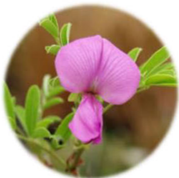
ニューロフロリン ～抗ストレスホルモン抑制～

インドの伝統的なアーユルヴェーダで用いられる ナンバンクサフジから発見された成分です。 抗ストレスホルモン「コルチゾール」の過剰な 発生を抑制し、リラクゼーションホルモン 「 \beta -エンドルフィン」の産生を促進することで、 ストレスによる様々な肌トラブルを防いで健やかな お肌を蘇らせます。